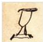
Der kleine Kelch links oben zeigt, daß der Empfänger ein Pastor ist.