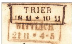
Aufgabe und Ankunftsstempel von Wittlich und Trier.

Der Aufgabestempel in Trier am 18.11.???.??.? angebracht. Bei der Ankunft in Wittlich wurde der Rechteckstempel Wittlich unterhalb des Trierer Aufgabestempels angebracht. Die blaue „2“ auf der Briefvorderseite zeigt, dass der Brief vom Empfänger bezahlt werden musste.